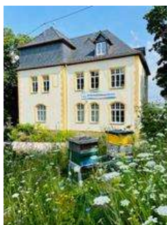
Bienentränke aus Moos und Bienen- und Erlebnispark Infozentrum Hermeskeil, Foto: © Naturpark Saar-Hunsrück* *freie Nutzung im Kontext dieser Pressemeldung