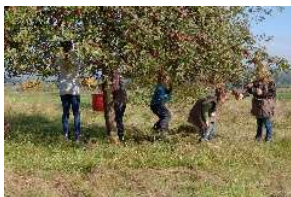
Apfelernte auf Obstwiese

Weitere Informationen zum Naturpark unter www.naturpark.org und @naturparksaarhunsrueckpflanzen/