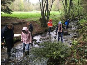
WasserWissensExkursion: Lebensraum Bach

sante Kleinstlebewesen wie z. B. Flohkrebse oder Köcherfliegenlarven. Im Blauen Klassenzimmer des WasserWissensWerks werden die Tiere unter Mikroskopen einmal genauer bestimmt und danach wieder zurück in ihren Lebensraum Bach gebracht. Der informative und spannende Ausflug an den Bach richtet sich an Kinder ab 8 Jahren in Begleitung sowie an Erwachsene. Bitte Gummistiefel und med. Maske für das WasserWissensWerk mitbringen. Die Teilnahme ist kostenfrei. Der Treffpunkt ist am WasserWissensWerk, Am Steinberg 1, 55758 Kempfeld. Eine Anmeldung ist beim WasserWissensWerk, Telefon 06786 290 93 210 (Mi-Fr 10-17 Uhr) oder unter info@wzv-birkenfeld.de erforderlich. Weitere Informationen zum Naturpark unter www.naturpark.org und @naturparksaarhunsrueck