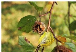
essbare Bucheckern im Herbst

Weitere Informationen zum Naturpark: Naturpark-Geschäftsstelle in Hermeskeil, Tel. 06503/9214-0, info@naturpark.org