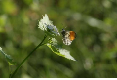
Foto: @ Aurorafalter auf Knoblauchrauke_Naturpark Saar-Hunsrück/VDN/Johannes Nutt

Der Treffpunkt wird bei der Anmeldung bekanntgegeben. Die Teilnahmegebühr beträgt 9 Euro pro Person inklusive Kräutersnack. Die Teilnehmerzahl ist begrenzt. Eine frühzeitige Anmeldung ist bei der Naturpark-Geschäftsstelle in Hermeskeil, Telefon 06503/9214-0, erforderlich.