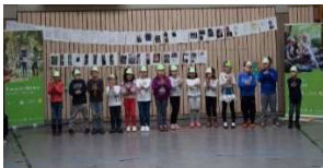
Kinder der Grundschule Züsch beim Vortag eines Frosch-Liedes

Weitere Informationen: Geschäftsstelle Naturpark Saar-Hunsrück, Trierer Straße 51, 54411 Hermeskeil, Tel. 06503/9214-0, info@naturpark.org .