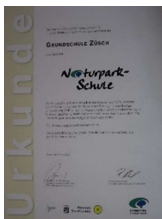
Foto: © Urkunde Auszeichnung der Grundschule Züsch als "Naturpark-Schule"_Naturpark Saar-Hunsrück