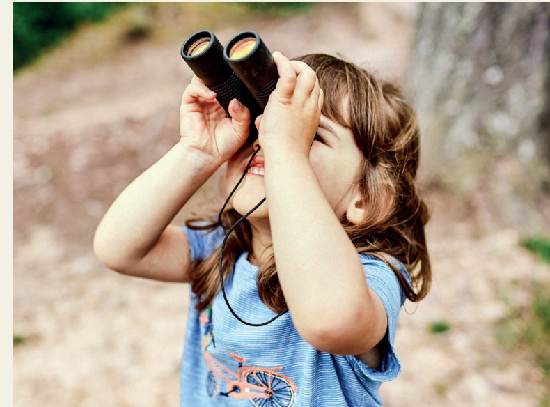
Text: Annika Horstick, VDN