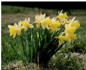
Wilde Narzissen im Ruwertal

Am Sonntag, 26. März, ab 10 Uhr , veranstaltet die Ortsgemeinde Schillingen und Hochwald-Ferienland e. V. in Kooperation mit dem Naturpark Saar-Hunsrück das alljährliche Narzissenfest. Im zeitigen Frühling kann man im oberen Ruwertal wieder ein Naturschauspiel bewundern, wie es dies sonst nur noch an wenigen anderen Standorten in Deutschland gibt. Abertausende der leuchtend gelben, wilden Narzissen bedecken die Wiesen und bieten den Besuchern einen herrlichen Anblick. Ein kleiner Markt bietet Produkte zum Probieren und Kaufen an. Treffpunkt ist das Freizeitzentrum in Schillingen. Weitere Informationen erhalten Sie bei der Tourist-Information Hochwald-Ferienland, 06589/1044, info@hochwald-ferienland.de .