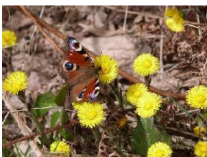
Huflattich mit Schmetterling im Frühling

Am Samstag, 25. März, 14 bis 17 Uhr , führt der Naturpark Saar-Hunsrück Hunsrück in Kooperation mit der Gemeinde Mettlach eine kulinarische Frühlings-Wildkräuterwanderung um Orscholz durch. Zusammen mit dem Naturpark-Referenten Guido Geisen können die heimischen Wildkräuter, wie Huflattich, Hirtentäschelkraut, Sauerampfer, Spitzwegerich, Frauenmantel, Vogelmiere & Co., die viele Mineralstoffe und wertvolle Spurenelemente enthalten und den Stoffwechsel und die Vitalität anregen, erkundet werden. Mit diesen regionalen, natürlichen Vitaminhaltigen Wildpflanzen kann die Frühlingsküche bereichert werden. Wie köstlich und nahrhaft diese Wildkräuter schmecken, kann bei der Verkostung von kleinen Kräutersnacks probiert werden. Der Treffpunkt wird bei der Anmeldung bekanntgegeben. Die Teilnahmegebühr beträgt 14 Euro pro Erwachsenen und 7 Euro pro Kind. Der Treffpunkt wird bei Anmeldung bekannt gegeben. Eine verbindliche Anmeldung ist bei der Naturpark-Geschäftsstelle in Hermeskeil, Telefon 06503/9214-0, erforderlich (Teilnahmebegrenzung).