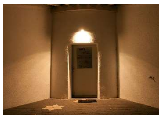
Gesundes Licht, Eingang Sternwarte Peterberg, Foto: © NPSH_Christoph Pütz* *freie Nutzung im Kontext dieser Pressemeldung

Informationen zum Naturpark: Naturpark-Geschäftsstelle in Hermeskeil, Tel. 06503/9214-0, www.naturpark.org und @naturparksaarhunsruock