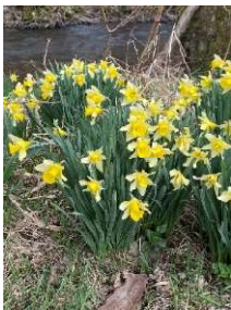
Wilde Narzissen im Naturpark Saar-Hunsrück