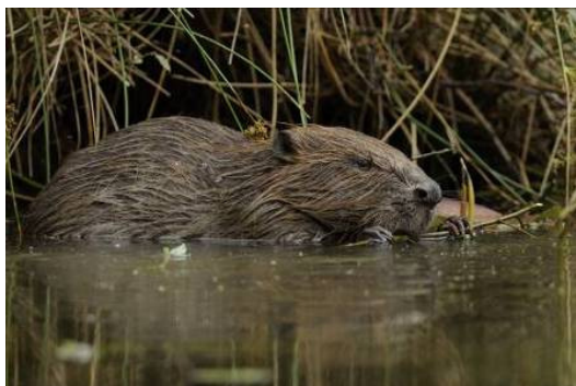
Foto: Spannende Biber-Entdecker-Tour im Naturpark Saar-Hunsrück