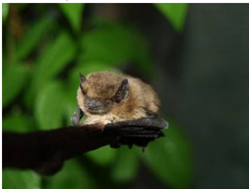
Bildnachweis: Junge Fledermaus_VDN_Günther Desch

Landkreis Trier-Saarburg/Verbandsgemeinde Kell am See/Schillingen