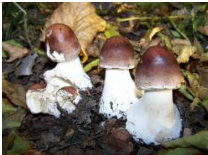
Foto: Junge Großschirmlinge