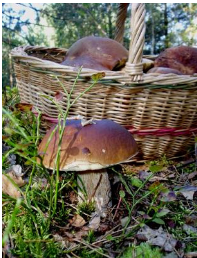
Foto: Kostenlose Pilzberatung in Weiskirchen