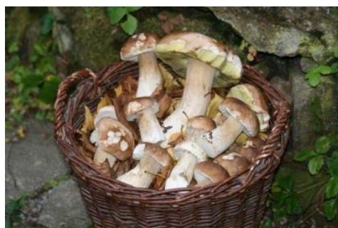
Foto: Kulinarische Pilzexkursion im Naturpark Saar-Hunsrück