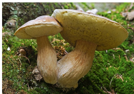
Foto: Pilze richtig bestimmen – spannende Pilzexkursion im Naturpark Saar-Hunsrück

Treffpunkt wird bei Anmeldung mitgeteilt. Die Teilnahmegebühr beträgt 8 Euro pro Person, Kinder bis 14 Jahre können kostenlos teilnehmen. Die Teilnehmerzahl ist begrenzt. Eine frühzeitige Anmeldung ist bei der Naturpark-Geschäftsstelle, Telefon 06503/9214-0 erforderlich.