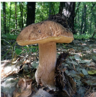
Foto: Pilze richtig bestimmen – kulinarische Pilzexkursion im Naturpark Saar-Hunsrück

Am Sonntag, 9. Oktober, 10 bis 13 Uhr kommen Pilzfreunde ganz auf Ihre kulinarischen Kosten. Entdecken und Bestimmen für Groß und Klein – im Naturpark Saar-Hunsrück ist das gemeinsam mit dem Naturpark-Referent Dirk Gerstner möglich. Rund um den Wendelinushof in der Naturpark-Stadt St. Wendel geht es auf eine interessante Entdeckertour. Neben wissenswerten Infos zur Lebensweise der Pilze und Ihrer Bedeutung für das Ökosystem Wald, erhalten alle Teilnehmenden wichtige Tipps zum Bestimmen der Pilze. Welche Pilze sind ungenießbar oder sogar giftig, welche eignen sich zum Verzehr. Desweiteren erhalten die Teilnehmenden interessante Informationen zur Zubereitung schmackhafter Pilzgerichte. Bei der familienfreundlichen Exkursion können kleine Mengen Pilze für eine leckere Mahlzeit gesammelt werden. Als Ausrüstung werden witterungsangepasste Kleidung und festes Schuhwerk empfohlen. Der Treffpunkt wird bei Anmeldung mitgeteilt. Die Teilnahmegebühr beträgt 8 Euro pro Person. Die Teilnehmerzahl ist begrenzt. Eine frühzeitige Anmeldung ist bei der Naturpark-Geschäftsstelle, Telefon 06503/9214-0 erforderlich.