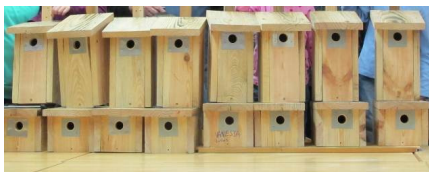
Foto: Workshop „Vogelnist- und Schutzkastenbau“