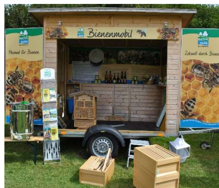
Bild 10 Mobile Bienen-Erlebniswelt