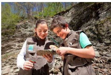
Bild 1 Naturpark-Entdecker-Westen