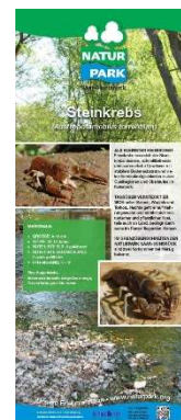
Bild 11 Roll-up Flusskrebbsaus- stellung