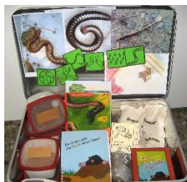
Bild 4 Bodenkoffer