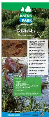
Bild 2 Roll-up Flusskrebbsaus- stellung