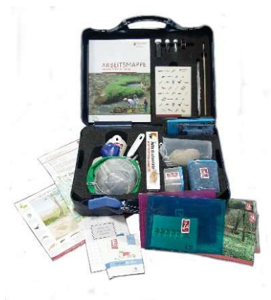
Bild 6 Wasser-Erlebnis-Koffer