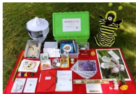
Bild 2 Bienenkoffer