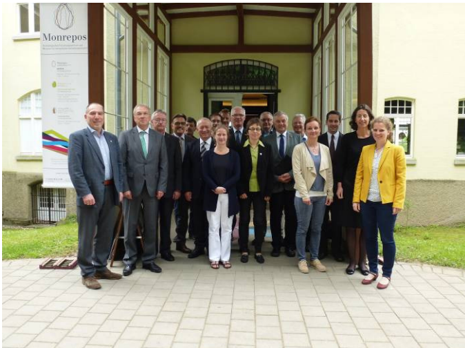
Bild: Die Vorsitzenden der Naturparke in Rheinland-Pfalz trafen sich zum jährlich stattfindenden Zukunftsgespräch.