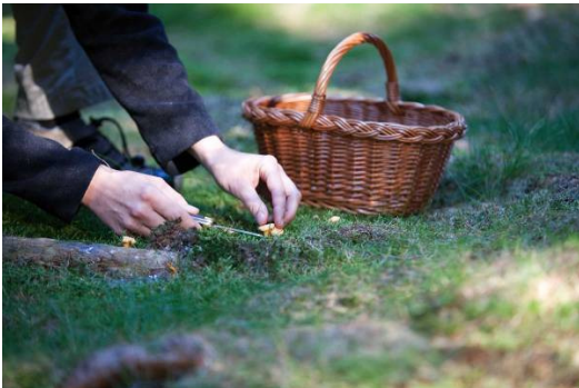
Foto: Spannende Pilzexkursion im Naturpark Saar-Hunsrück