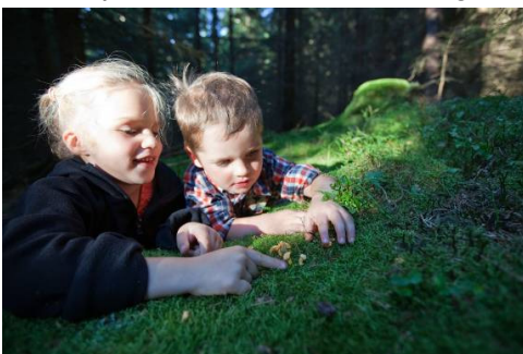
Foto: Spannender Pilznachmittag für kleine Entdecker im Naturpark Saar-Hunsrück