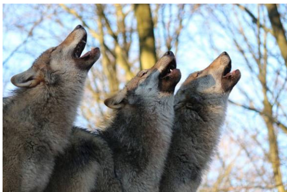
Wolfsheulen im Wildfreigehege Wildenburg