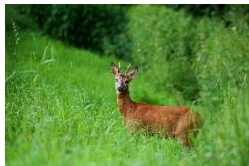
Rehbock am Waldrand

Weitere Informationen zum Naturpark: Naturpark-Geschäftsstelle in Hermeskeil, Tel. 06503/9214-0, info@naturpark.org