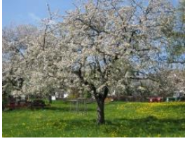
Foto: Streuobstwiese im Frühling.