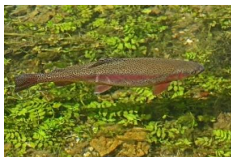
Foto: Regenbogenforelle im Naturpark Saar-Hunsrück