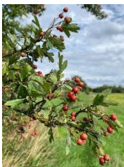
Frucht des Weißdorns

Am Samstag, 16. September, 14 bis 17 Uhr , bietet der Naturpark Saar-Hunsrück in Kooperation mit der Verbandsgemeinde Hermeskeil eine kulinarische Wildkräuterwanderung rund um die Naturpark-Ortsgemeinde Damflos an. Zusammen mit der Naturpark-Kräuterpädagogin Klaudia Landahl werden die heimischen Wildpflanzen im Herbst, mit ihren essbaren wilden Samen, Beeren, Früchten, Wurzeln etc. erkundet. Wie köstlich, nahrhaft und wertvoll heimische Wildpflanzen sein können und wie diese sowohl in der Küche als auch der Hausapotheke eingesetzt werden können, kann während der Wanderung erfahren werden. Als Ausrüstung werden festes Schuhwerk, witterungsangepasste Kleidung sowie ein Korb und Messer zum Sammeln empfohlen. Die Teilnahmegebühr beträgt 12 Euro pro Person inklusive Kräutersnack. Der Treffpunkt wird bei Anmeldung bekannt gegeben. Eine verbindliche Anmeldung ist bei der Naturpark-Geschäftsstelle in Hermeskeil, Telefon 06503/9214-0, erforderlich (Teilnahmebegrenzung).