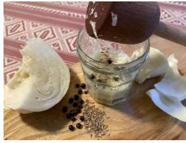
Sauerkraut im Glas