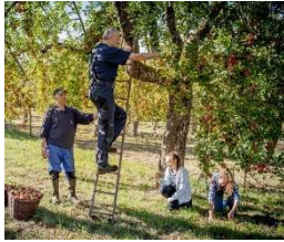
Apfelernte im Naturpark