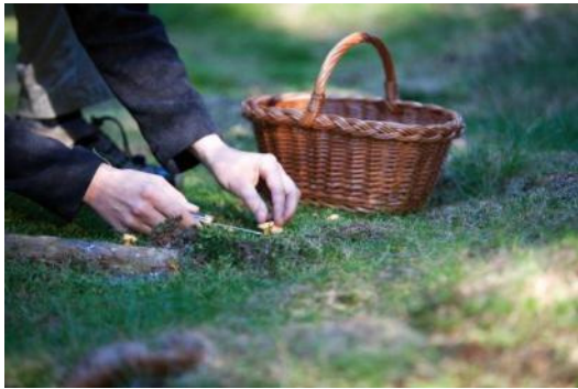
Foto: Spannende Pilzexkursion im Naturpark Saar-Hunsrück