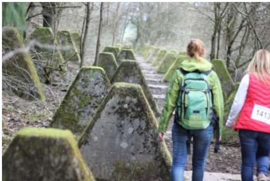
Foto: 24-Stunden-Wandermarathon durch den Naturpark Saar-Hunsrück