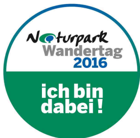
Foto: Logo Naturpark-Wandertag 2016