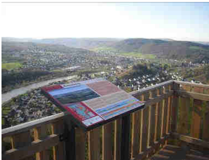
Foto: Blick von der Aussichtsplattform auf dem „Saarburger Kreuzberg“