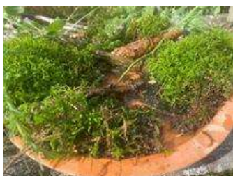
Insektentränke aus Moos, Zapfen, Zweigen

Informationen zum Naturpark: Naturpark-Geschäftsstelle in Hermeskeil, Tel. 06503/9214-0, info@naturpark.org .