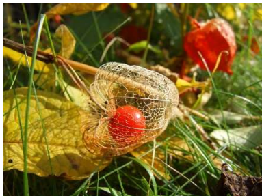
buntes Herbstlaub und Pflanzenstängel