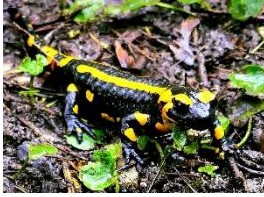
Feuersalamander, Höhlentier 2023, Foto: © Naturpark_VDN-Fotoportal_Uwe Liebe* *freie Nutzung im Kontext dieser Pressemeldung