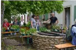
Naturpark-Infostelle Haus Saargau

Weitere Informationen bei der Tourist-Info Saarlouis, Tel. 0 68 31 / 444-449 oder www.rendezvous-saarlouis.de .