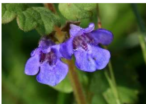
Gundermann Foto: © Naturpark_VDN-Fotoportal/Volkmar Brockhaus* *freie Nutzung im Kontext dieser Pressemeldung

Am Samstag, 3. Juni, 10 bis 13 Uhr , führt der Naturpark Saar-Hunsrück in Kooperation mit der Gemeinde Mettlach eine kulinarische Wildkräuterwanderung rund um die Naturpark-Dorf Tünsdorf durch. Die Naturpark-Wildkräuterreferentin Klaudia Landahl gibt interessante Informationen zum Kennenlernen der Pflanzenfamilien, der wertvollen Inhaltsstoffe der Wildkräuter und deren Wirkung und Verwendung in der Küche und Hausapotheke. Sie zeigt, wie unsere heimischen Wildpflanzen, wie z. B. Löwenzahn, Frauenmantel, Gundermann, Spitzwegerich, Taubnessel & Co. richtig gesammelt werden, getrocknet, aufbewahrt und weiterverarbeitet werden können und wie sie schmecken. Die Teilnahmegebühr beträgt 12 Euro pro Person inklusive Kräutersnack. Der Treffpunkt wird bei Anmeldung bekannt gegeben. Eine verbindliche Anmeldung ist bei der Naturpark-Geschäftsstelle in Hermeskeil, Telefon 06503/9214-0, erforderlich (Teilnahmebegrenzung).