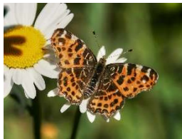
Landkärtchen, Insekt des Jahres 2023, Foto: © Naturpark_VDN-Fotoportal_Ulrike Sobick* *freie Nutzung im Kontext dieser Pressemeldung

Informationen zum Naturpark: Naturpark-Geschäftsstelle in Hermeskeil, Tel. 06503/9214-0, www.naturpark.org und @naturparksaarhunsrueck