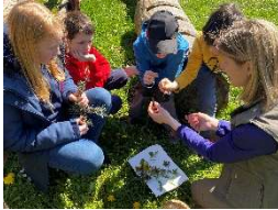
Faszination Natur mit Kindern, Foto: © Naturpark Saar-Hunsrück* *freie Nutzung im Kontext dieser Pressemeldung

Landkreis Merzig-Wadern/Gemeinde Mettlach/Tünsdorf