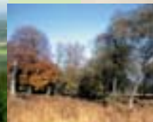
Palmbuch im Hunsrück