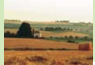
Urwahleler Kapelle im Spätsommer