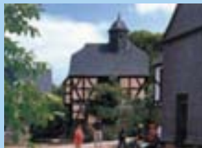
Freilichtmuseum Roscheider Hof