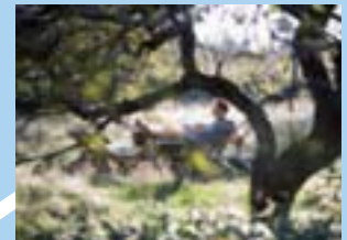
Entspannen am Saar-Hunsrück-Steig