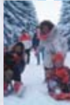
Schlittenfahrt im Hunsrück

„Ich genieße Natur und Kultur mit all ihren Vorzügen und Möglichkeiten in einer lebendigen, freundlichen und offenerzigen Region.“