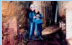
Emilianusstollen in Wallerfangen- St. Barbara