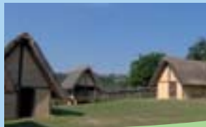
Keltensiedlung bei Bundenbach