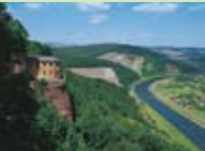
Klause bei Kastel-Staadt, Blick ins Saartal

„Wunderschöne Landschaft: Lebensraum eingebettet in Felder und Wiesen, angeschmiegt an steile Täler und ausgestattet mit üppigen Farben und Formen – ein Sinnesreigen.“