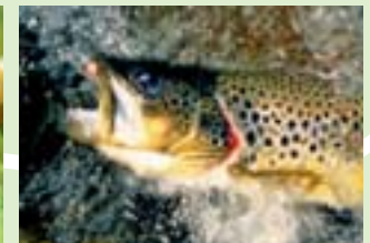
Frische Forellen – ein Hochgenuss