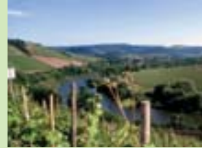
Blick von der Wiltinger Kupp auf den Altarm der Saar