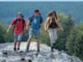
Keltischer Ringwall Otzenhausen