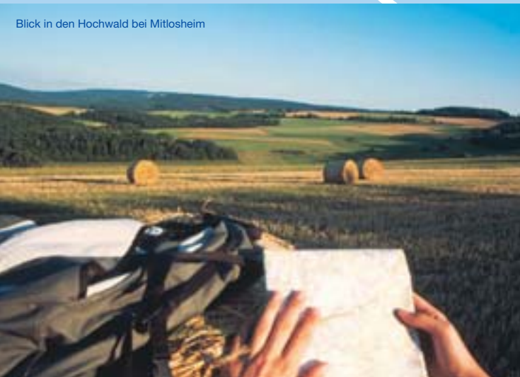
Blick in den Hochwald bei Mitlosheim

„Erd- und Kulturgeschichte sind spannende Wegbegleiter auf der Reise durch den Naturpark.“