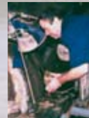
Edelsteinschleiferei Asbacher Hütte