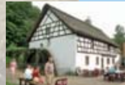
Johann-Adams-Mühle bei Theley