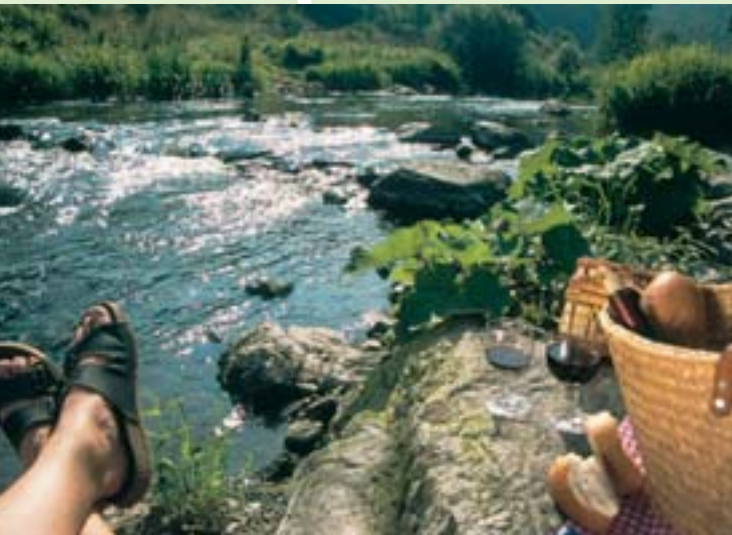
Picknick an der Nahe

„Nun weiß ich, wie Landschaft schmeckt.“