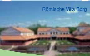
Römische Villa Borg