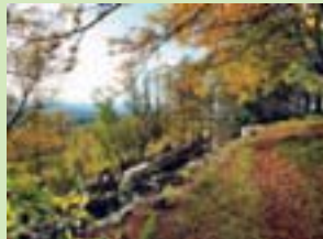
Rosselhalde Mörschieder Burr