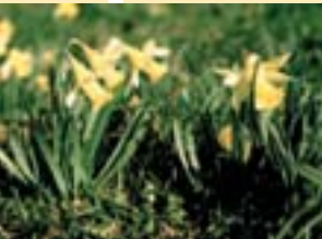
Narzissenwiese bei Zerf