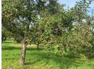
Streuobstwiese mit Äpfeln

sowie in der Küche werden vorgestellt. Im Anschluss an die Wanderung können kleine Apfel-Pfannkuchen beim Picknick auf der Wiese probiert werden. Als Ausrüstung werden festes Schuhwerk, witterungsangepasste Kleidung sowie ein Korb und Messer zum Sammeln empfohlen. Die Teilnahmegebühr beträgt 12 Euro pro Person inklusive Apfelkuchensnack. Der Treffpunkt wird bei Anmeldung bekannt gegeben. Eine verbindliche Anmeldung ist bei der Naturpark-Geschäftsstelle in Hermeskeil, Telefon 06503/9214-0, erforderlich (Teilnahmebegrenzung).