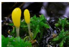
Sumpf-Haubenpilz, Pilz des Jahres 2023

Informationen zum Naturpark: Naturpark-Geschäftsstelle in Hermeskeil, Tel. 06503/9214-0, info@naturpark.org