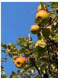
Äpfel in der Streuobstwiese

Am Sonntag, 24. September, 10 bis ca. 13:00 Uhr , bietet der Naturpark Saar-Hunsrück in Kooperation mit der Naturpark-Gemeinde Losheim am See eine kulinarische Wanderung durch die Streuobstwiese durch. Die Veranstaltung ist Bestandteil des Erlebnisprogrammes der Gesundheitstage in Losheim am See. Die Naturpark-Referentin Nina Brücker stellt Früchte, Beeren und Wildkräuter vor. Während der Wanderung erhalten die Teilnehmenden interessante Informationen zur Wirkungsweise und zur Botanik der Wildpflanzen. Auf der Streuobstwiese können auch die Obstprodukte, wie Apfelsaft, Viez, Apfel-Kalvados, und -Secco, Edelobstbrand oder Apfelingeringe von der Regionalinitiative Ebbes von Hei! probiert werden. Die Teilnahme an der Wanderung kostet 12 Euro pro Person inkl. Wildkräutersnack. Der Treffpunkt wird bei Anmeldung bekannt gegeben. Eine verbindliche Anmeldung ist bei der Naturpark-Geschäftsstelle in Hermeskeil, Telefon 06503/9214-0, erforderlich (Teilnahmebegrenzung).