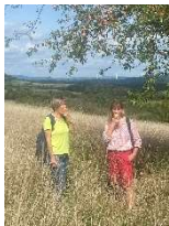
Genuss von der Streuobstwiese

Weitere Infos gibt es auf www.ebbes-von-hei.de sowie www.naturpark.org