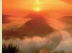
Saarschleife bei Mettlach