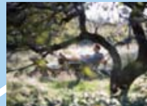
Entspannen am Saar-Hunsrück-Steig