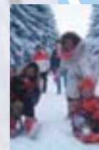
Schlittenfahrt im Hunsrück

„Ich genieße Natur und Kultur mit all ihren Vorzügen und Möglichkeiten in einer lebendigen, freundlichen und offenerzigen Region.“