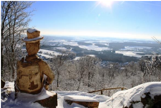
Foto: Blick vom Schaumberg ins Sankt Wendeler Land