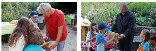
Kinder bei der Honigernte im Bienentracht- und Erlebnisgarten Hermeskeil