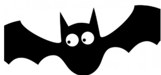
Birkenfelder Nachtleben - Fledermausexkursion für Kinder