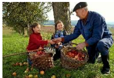
Genuss von der Streuobstwiese

Ebbes von Hei! Betriebe arbeiten nachhaltig und halten bei der Bewirtschaftung der Streuobstwiesen eine alt hergebrachte bäuerliche Versorgungswirtschaft aufrecht, damit auch die mannigfaltige Sortenvielfalt bewahrt wird. Die vorhandenen Obstsorten mit ihren vielfältigen Resistenz- und Verwertungseigenschaften sind eine genetische Ressource von unschätzbarem Wert und ein wichtiger Beitrag zur Biodiversität. Die regionalen Sorten wie Winterrambur und Goldparmäne können genussvolle Kreationen auf den herbstlichen Speise-Tellern werden. Die Betriebe haben in den vergangenen Jahren viele neue, innovative und genussvolle Produkte entwickelt. Unter dem Motto „Vieztrinker sind Genießer und Naturschützer“ sollen sie mit den Veranstaltungen offensiv vermarktet werden. Beginnend mit Kelterfesten in den Betrieben über das Erntedankfest bis zum Tag der Deutschen Einheit werden Streuobst und deren Veredelungsprodukte in aller Munde sein. Einige unserer Gastronomen werden in Restaurants und Gaststätten mit allen kulinarischen Reizen Zwetschen, Mirabellen, Nüsse und edelste Brände in den Mittelpunkt ihrer Kochkünste stellen. Täglich ab dem 20. September aktuelle Posts auf www.ebbes-von-hei.de / Facebook.com Regionalinitiative Ebbes von Hei www.ebbes-von-hei.de , Verein Viezstraße www.viezstraesse-online.de , Naturpark Saar-Hunsrück www.naturpark.org/aktuelles ,