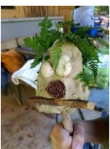
Naturkunstwerk, Foto: © Ulla Petto-Spies

Die Veranstaltung richtet sich an Kinder ab 8 Jahren. Der Treffpunkt wird bei der Anmeldung bekanntgegeben. Die Teilnahme an der Veranstaltung ist kostenlos. Die Teilnehmerzahl ist aufgrund der Corona-Vorschriften begrenzt. Eine verbindliche Anmeldung ist bei der Naturpark-Geschäftsstelle in Hermeskeil, Telefon 06503/9214-0, erforderlich.