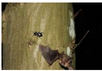
Braune Langohrfledermaus, Foto: © Naturpark/Markus Utesch

Als Ausrüstung wird eine Taschenlampe empfohlen. Der Treffpunkt wird bei der Anmeldung bekanntgegeben. Die Teilnahme an der Veranstaltung ist kostenlos. Die Teilnehmerzahl ist aufgrund der Corona-Vorschriften begrenzt. Eine verbindliche Anmeldung ist bei der Naturpark-Geschäftsstelle in Hermeskeil, Telefon 06503/9214-0, erforderlich.