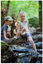
Kinder am Wasser

Regionalstelle Nordsaarland des Ferienfreizeitprogramms Saarland, bei der KEB im Kreis Saarlouis e. V., Gerhard Alt, Telefon 06831/760241, E-Mail: gerhard.alt@keb-dillingen.de erforderlich. Weitere Informationen über den Naturpark erhalten Sie bei der Naturpark-Geschäftsstelle Hermeskeil, Telefon 06503/9214-0 und info@naturpark.org .