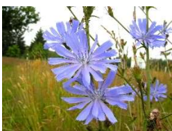
Wegwarte, Foto: © Naturpark/VDN/Johann Schuster

Weitere Infos z. B. unter https://www.kostbarenatur.net/anwendung-und-inhaltsstoffe/wegwarte/ . Informationen über den Naturpark erhalten Sie bei der Naturpark-Geschäftsstelle Hermeskeil, Telefon 06503/9214-0 und info@naturpark.org .