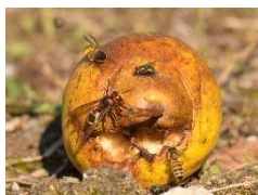
Fallobst Nahrung für Insekten

Weitere Informationen zum Naturpark unter www.naturpark.org und @naturparksaarhunsrueck