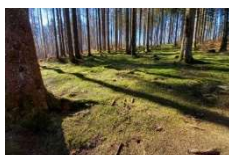
Mit Moorhexe Isolde auf Wanderschaft zu den Hochwaldbrüchern

Am Sonntag, 6. November, 10.00 bis 13.30 Uhr , führt die Tourist-Information des Birkenfelder Landes in Kooperation mit dem Naturpark Saar-Hunsrück eine spannende Wanderung mit der Moorhexe Isolde zu den Hochwaldbrüchern rund um Thranenweiher durch. Erleben sie die Wild- und Vogelreichen Wälder des Hochwaldes bei Geschichten aus den Hunsrückmooren bzw. -brüchern. Die einzigartige Flora können Sie gemeinsam mit der zertifizierten Nationalparkführerin, Beate Thome, beim Blick ins Moor erkunden und vielleicht auch noch dem Röhren der Hirsche lauschen. Zum Abschluss der Wanderung kann ein Moorgeist-Trunk gekostet werden. Die Veranstaltung ist geeignet für Erwachsene und Familien mit Kindern ab 8 Jahre. Die Streckenlänge beträgt ca. 8 km bei einem leichten Schwierigkeitsgrad. Die Teilnahme kostet 10 € pro Person. Der Treffpunkt befindet sich am Wanderparkplatz "Börfinker Ochsentour" an der K49 (Nähe Bunker Erwin), 54422 Börfink. Eine Anmeldung ist bei der Tourist-Information des Birkenfelder Landes, Telefon 06782-9834570 oder unter: www.birkenfelder-land.de/erlebnisse-buchen erforderlich.