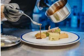
Gericht bei Omas Küche

Weitere Informationen zum Naturpark: Naturpark-Geschäftsstelle in Hermeskeil, Tel. 06503/9214-0, www.naturpark.org .