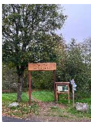
Traumschleife Lecker Pfädchen,

Weitere Informationen unter https://wandermagazin.de/wahlstudio sowie bei der Naturpark-Geschäftsstelle in Hermeskeil, www@naturpark.org und bei der Tourist-Information Thalfang a. E., Tel. 06504/954097, www.erbeskopf.de