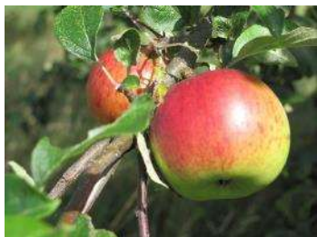
Leckerer Apfel von der Streuobstwiese

Am Samstag, 8. Oktober, 13:30 bis 16 Uhr , bietet der Naturpark Saar-Hunsrück in Kooperation mit der Naturpark-Gemeinde Losheim am See eine kulinarische Wanderung durch die Streuobstwiesen an. Streuobstwiesen sind unsere Paradiese der Heimat und bieten einen wichtigen Lebensraum für Pflanzen und Tiere dar. Bei der Wanderung kann zusammen mit der Naturpark-Referentin Nina Brücker die heimischen Wildkräuter und -früchte aus der Streuobstwiese erkundet werden. Wie genussvoll die Produkte aus der Streuobstwiese, wie Apfelbrot, Schlehen-Oliven, oder -mus und Wildkräuter-Apfellimonade sowie Beeren-Hagebutten Snacks schmecken, welche nahrhaften und wertvollen Inhaltsstoffe sie besitzen und wie die heimischen Wildpflanzen und ihre Früchte zubereitet werden, können die Teilnehmenden nach der Wanderung erfahren. Als Ausrüstung wird festes Schuhwerk, witterungsangepasste Kleidung sowie ein Korb und Messer zum Sammeln empfohlen. Die Teilnahmegebühr beträgt 12 Euro pro Person inklusive Streuobstwiesen-Snack. Der Treffpunkt wird bei Anmeldung bekannt gegeben. Eine verbindliche Anmeldung ist bei der Naturpark-Geschäftsstelle in Hermeskeil, Telefon 06503/9214-0, erforderlich (Teilnahmebegrenzung). Weitere Informationen zum Naturpark unter www.naturpark.org und @naturparksaarhunsrueck