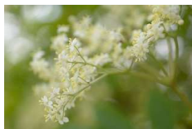
Blüte vom Schwarzen Holunder

Am Sonntag, 03. Juli, 10.00 bis 13.00 Uhr , lädt der Naturpark Saar-Hunsrück zu einer kulinarischen Sommerkräuter- und Holunderblütenwanderung in die Naturpark-Ortsgemeinde Schillingen ein. Im Juli bietet die Natur eine große Vielfalt an Wildkräutern, die den Speiseplan und die Hausapotheke bereichern können. Zusammen mit der Naturpark-Wildkräuterreferentin Helga Hofmann können die typischen Sommerkräuter wie Wilder Dost, Echtes Johanniskraut, Wilde Möhre & Co. erkundet werden. Welche Wildpflanzen im Juli gesammelt und welche Pflanzenteile wie Blüten, Blätter, Früchte oder Wurzeln genutzt werden können, kann bei der Wanderung erkundet werden. Zudem werden interessante Informationen zur Verwendung von Holunderblüten in der Küche vorgestellt. Als Ausrüstung wird festes Schuhwerk, witterungsangepasste Kleidung sowie ein Korb und Messer zum Sammeln empfohlen. Die Teilnahmegebühr beträgt 12 Euro pro Person inklusive Kräutersnack. Der Treffpunkt wird bei Anmeldung bekannt gegeben. Die aktuell gültigen Corona-Vorschriften sind zu beachten. Eine verbindliche Anmeldung ist bei der Naturpark-Geschäftsstelle in Hermeskeil, Telefon 06503/9214-0, erforderlich (Teilnahmebegrenzung).