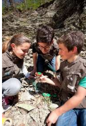
Expedition ins Erdreich

Weitere Veranstaltungen im Rahmen des Zukunfts-Diploms und Informationen finden Sie unter www.zukunftsdiplom.de .