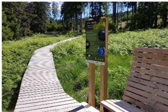
MINT-Wanderung am Erbeskopf

Anmeldungen zur Veranstaltung mit dem Betreff "MINT-Wanderung" per Mail an: m.fischer-krupp@umwelt-campus.de . Anmeldeschluss ist der 27. Juni 2022.