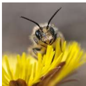
Faszinierende Bienenwelt, Blattschneidebiene

Weitere Veranstaltungen im Rahmen des Zukunfts-Diploms und Informationen finden Sie unter www.zukunftsdiplom.de .