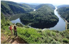
Nationales Geotop Saarschleife erwandern