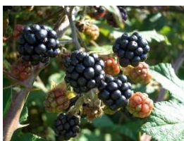
Brombeeren im Herbst

Weitere Veranstaltungen im Rahmen des Zukunfts-Diploms sowie Informationen finden Sie unter www.zukunftsdiplom.de .